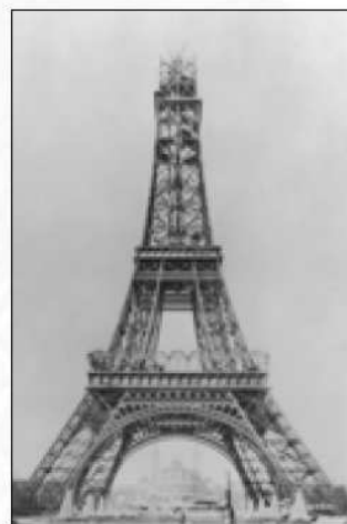
6 décembre 1888